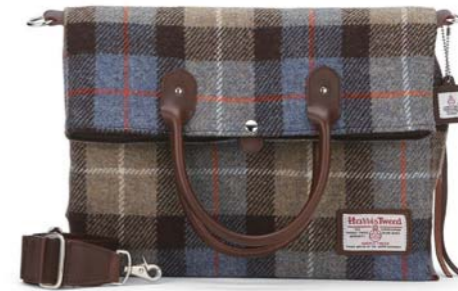
635406 BLUE CHECK JAN : 4980862 635465