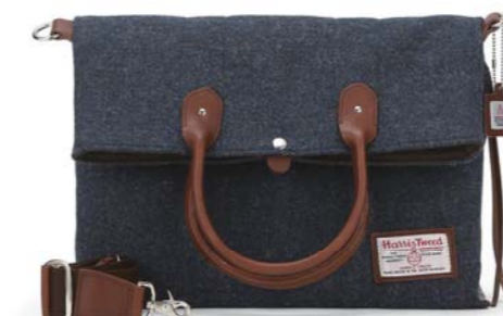
635401 BLUE JAN : 4980862 635410