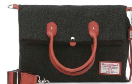
635402 HERRINGBONE JAN : 4980862 635427