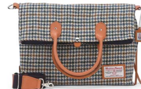
635404 HOUNDS TOOTH JAN : 4980862 635441