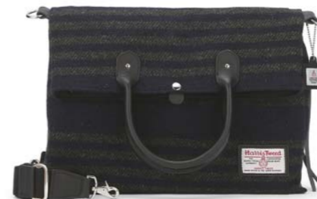
635403 BORDER JAN : 4980862 635434