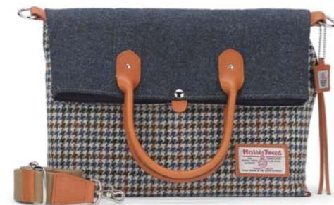
635302 HOUNDS TOOTH x BLUE JAN : 4980862 635328