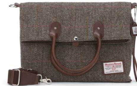
635405 HERRINGBONE CHECK JAN : 4980862 635458