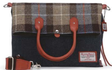
635301 BLUE x BLUE CHECK JAN : 4980862 635311