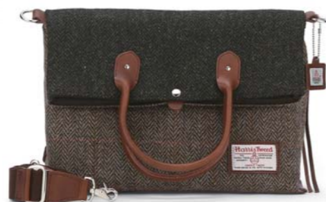
635303 HERRINGBONE CHECK x HERRINGBONE JAN : 4980862 635335